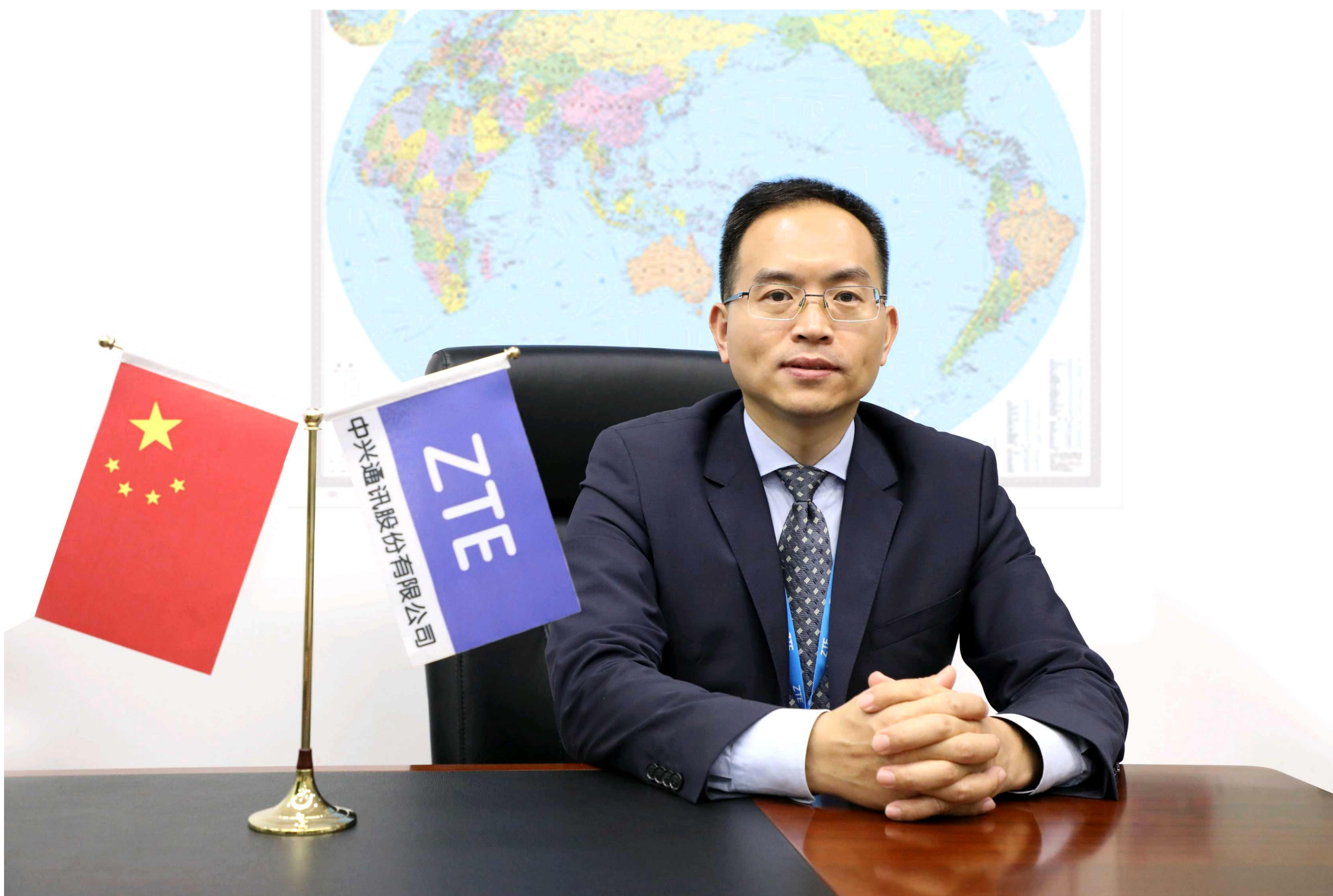
中兴通讯高级副总裁

沟通和交流是人类社会化的基本标准之一，21世纪初通讯技术的发展推动社会发生了翻天覆地的变化，无处不在的网络时时刻刻为人类提供无微不至的服务。